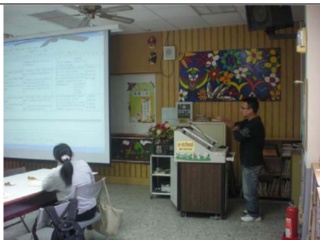
教師報告課程規劃