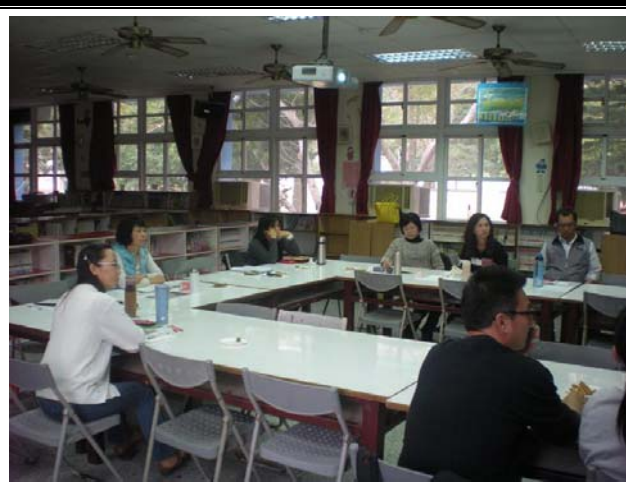
課程審查會議情況