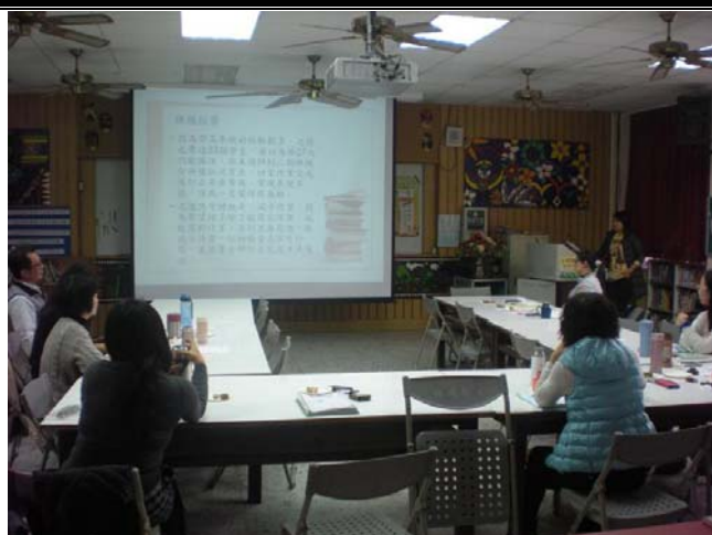
教師報告課程規劃