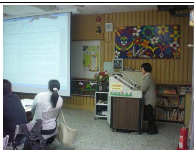
教師報告課程規劃