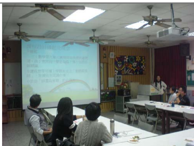
教師報告課程規劃