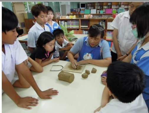
說明：指導學生製作陶章