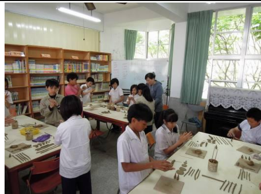
說明：指導學生搓土條、土球、水滴