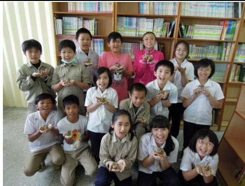
說明：指導學生製作小老鼠