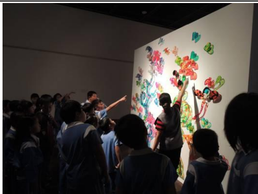
說明：參觀台東美術館