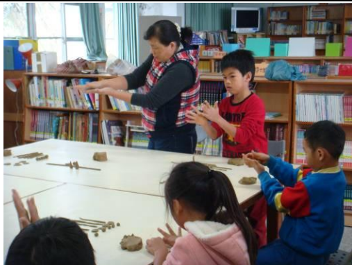
說明：指導學生搓土條、土球