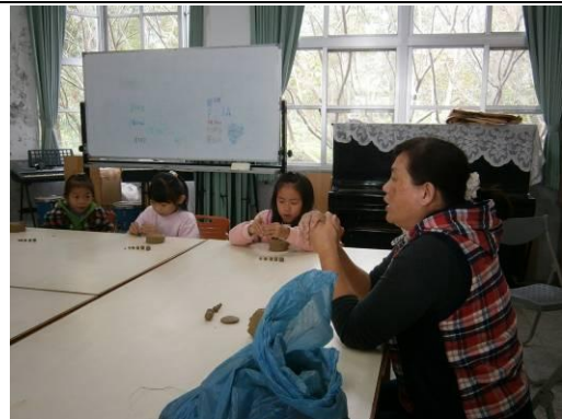
說明：指導學生搓土條