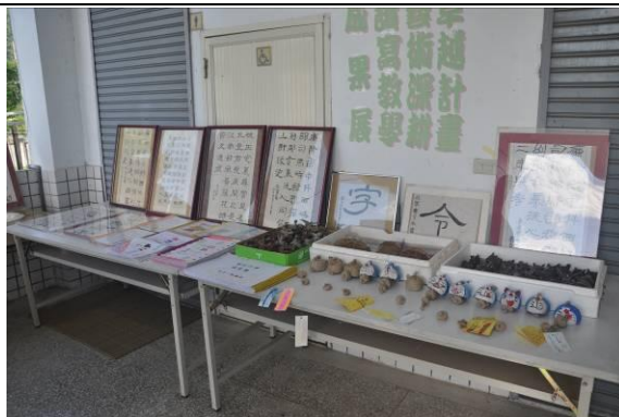
說明：藝文成果靜態展