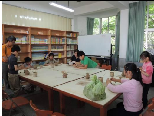
說明：指導學生製作創意筆筒