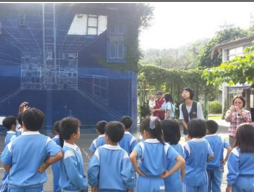
說明：參觀誠品故事館