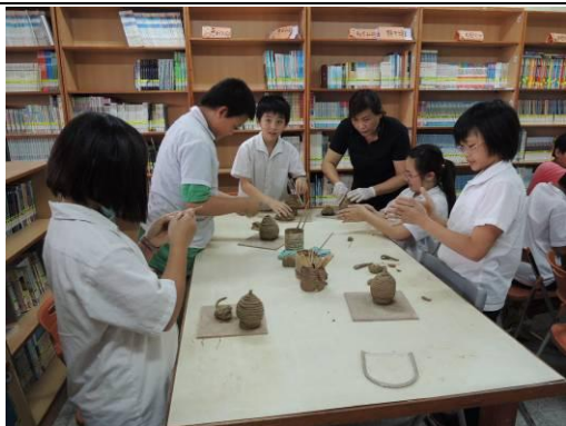
說明：指導學生製作存錢筒