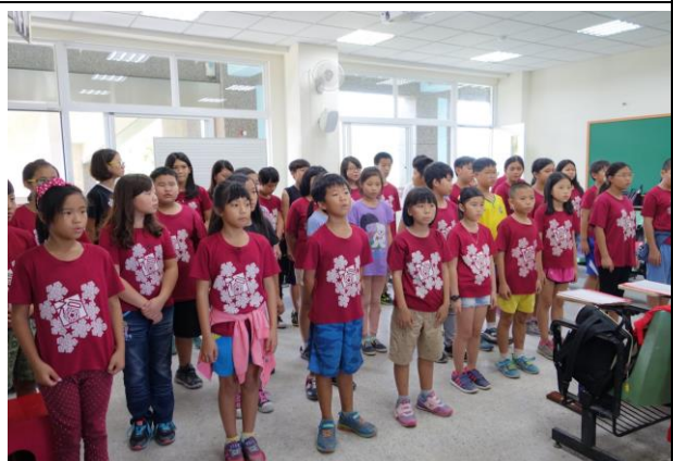
各班學生練習合唱的發聲及各項合唱技巧