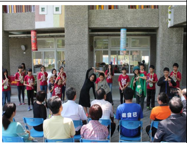
搭配廣達游於藝展覽開幕演出夏卡爾的戲劇