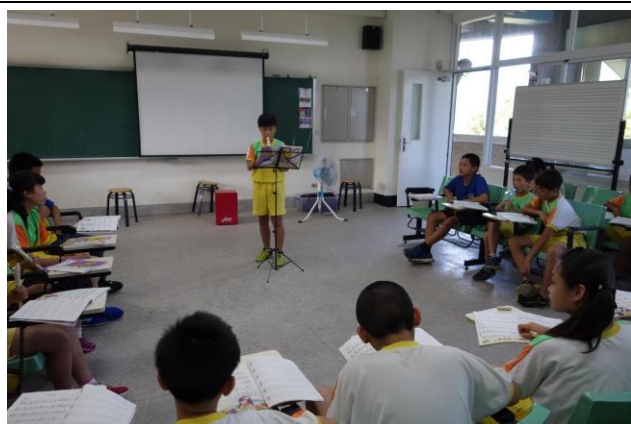
學生在課堂期末時吹奏直笛成果發表