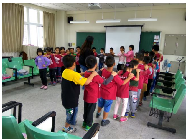
藝文老師教導學生兔子舞的舞蹈練習