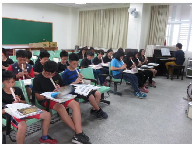
各年級學生在課堂上學習如何吹奏直笛