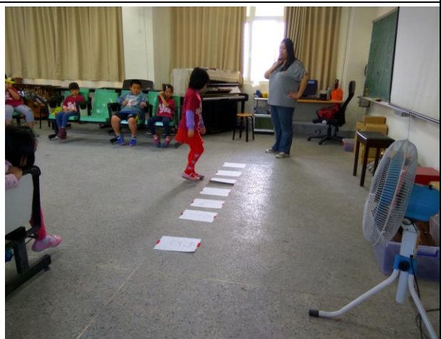
低年級學生透過遊戲的方式練習認識音階