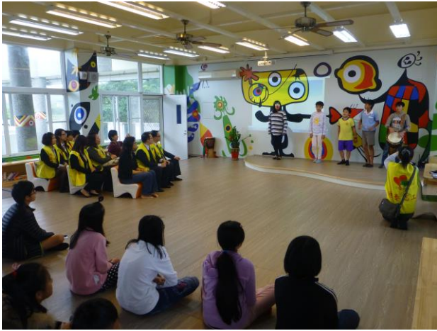
國泰基金會來訪~學生古謠及烏克麗麗音樂表演