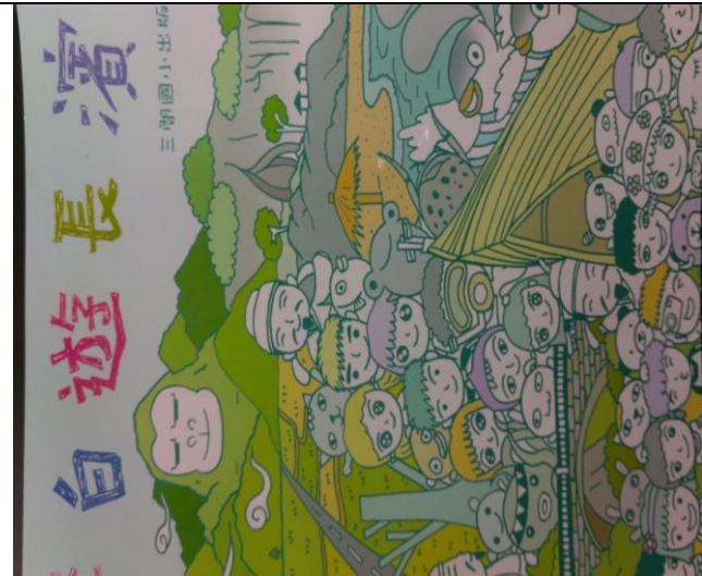
三間國小出版古謠歌集