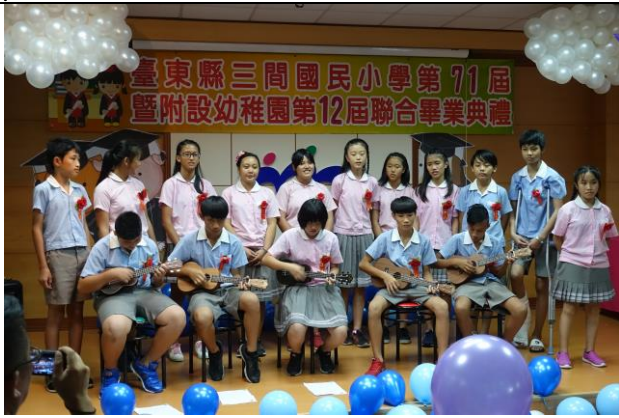
畢業典禮~畢業生烏克麗麗表演