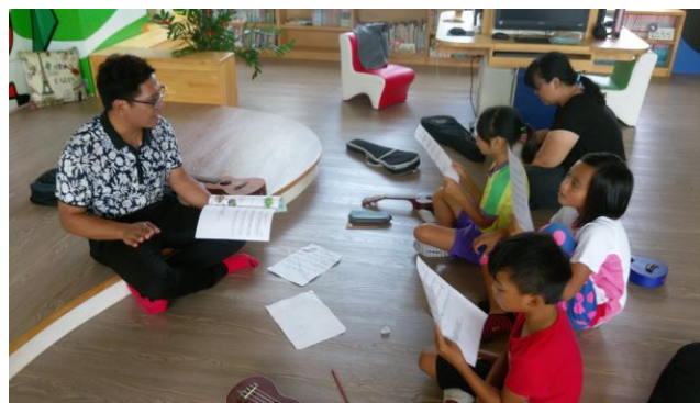
上課情形：樂理教學