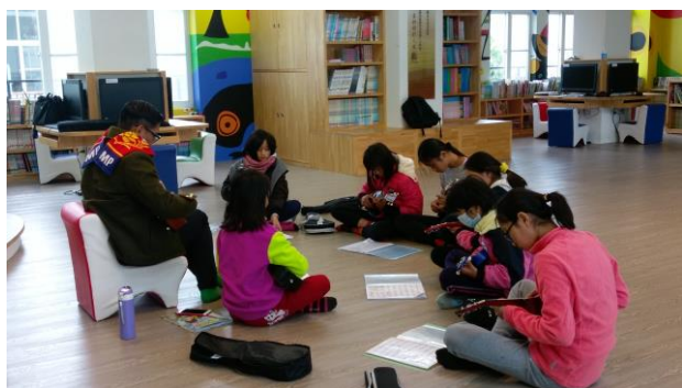
上課情形：示範教學