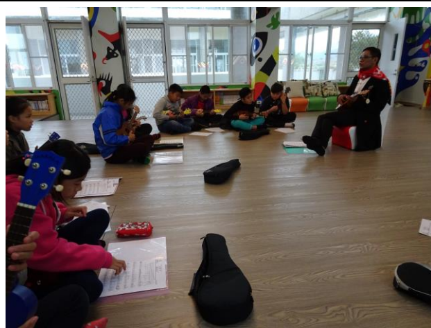
上課情形：指法教學