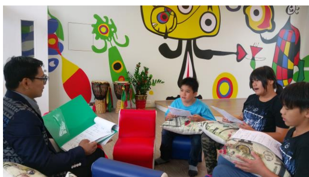
上課情形：古謠教學